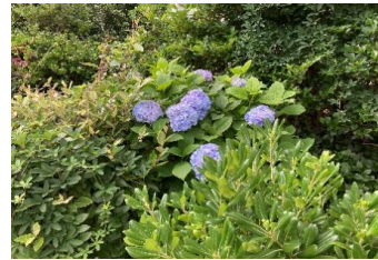
3号棟前の紫陽花 2024.6.8 撮影