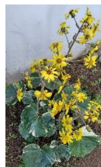
敷地内のツワブキ

スポーツ振興会主催のディスクドッジ大会が新年1月21日（日）に朝日ヶ丘小学校体育館で10時より開催されます。餅つき大会は12時からのスタートを予定しています。体を動かしてからお餅を食べるとより美味しいかと存じます。是非とも両大会へのご参加をお願いいたします。詳細は掲示にて改めてお知らせします。